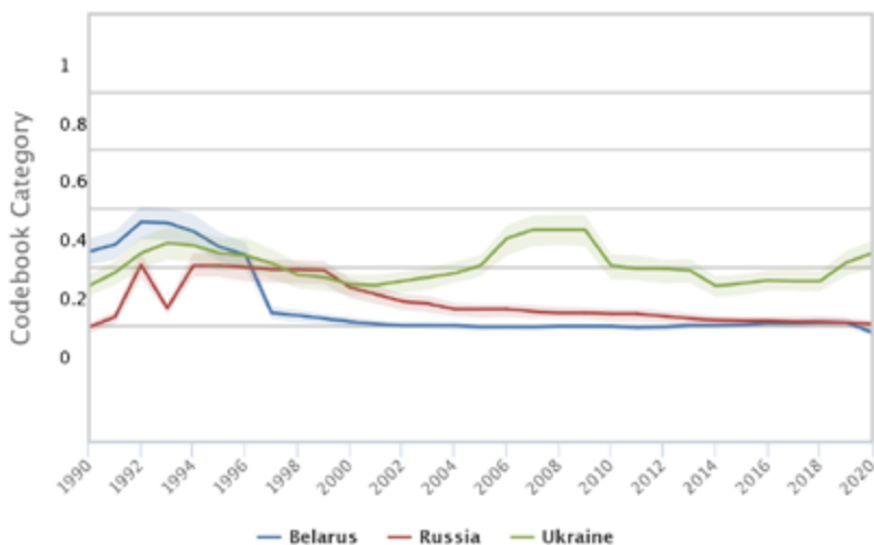
График 2. Индекс либеральной демократии в Беларуси, России и Украине в 1990–2020 гг.