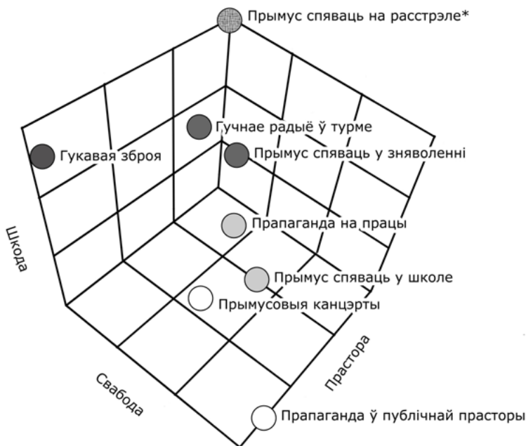
Мал. 1. Кантынуум гукавога гвалту

Месцамі гукавога ўздзеяння могуць быць публічныя прасторы рознага маштабу (вуліцы і плошчы, канцэртныя залі, стадыёны, кінатэатры, навучальныя ўстановы — двары, будынкі, класы), будынкі прадпрыемстваў і ўстаноў, міліцэйскі транспарт, адрэзлы міліцыі і іншых “сілавых” структур, прасторы зняволення рознага тыпу і рэжыму. Дыяпазон магчымасцяў пазбегнуць гукавога гвалту мае два полюсы — ад поўнай свабоды пакінуць месца непажаданага гукавога ўздзеяння, да немагчымасці не проста абараніцца ад гуку, а ўвогуле рухацца. Дыяпазон шкоды вар’іруецца ад нулявой шкоды да дыскамфорта, непасрэднай шкоды для здароўя (фізічнага ці ментальнага), калецтва і смерці.