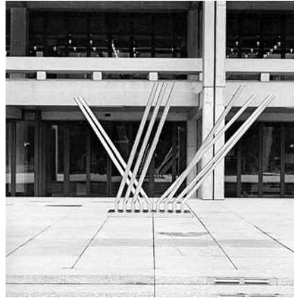
Ил. 7. Яков Агам. Все направления. 1970

Благодаря горизонтальному завершению элементы — вне зависимости от того, образуют они одинаковые или неодинаковые конstellации направ-