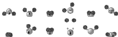
Рис. 2. Раскадровка анимации Cheerleader. 13 x 18 пикселей.

Создатель первых Easy-Toop-анимаций был сродни художнику, рисующему движущиеся миниатюры. Чтобы быть понятной и легко считываться при размере изображения 100 на 100 точек 3 , композиция должна стать выразительной. Отсюда – тенденция к плакатной простоте изображения и короткому сюжету. Межкадровая пустота, gap , исчезает потому, что у нас больше нет двух иллюстративно завершенных и целостных кадров. Их заменяет компьютерная перекладка, состоящая из бесчисленного множества кинематических ragdoll – моделей и совокупностей частиц, чье движение мы можем замедлять до любого мыслимого предела, удлинняя таким образом созерцание (историзацию) одной и той же сцены. Это – очередная стадия развития зэппинга 4 и удовлетворения монтажного голода.