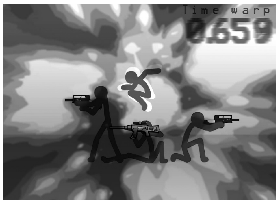
Рис. 3. Стикфайт «Acetrip». Автор Ace0fredspades. 2010 г. Режим доступа: https://www.youtube.com/watch?v=6YpEKFuRzvE

Нечто сходное происходит и с действующими лицами, которые лишаются своей внятной истории, мотивов и смыслов, превращаясь в векторы чистого пульсирующего свершения. Ярчайший пример сетевой анимации - cyriak , жанры stickfigure fighting («бои человечков») и madness combat 7 .