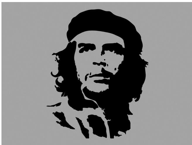
Рис. 5. Портрет Че Гевары. Автор Дж. Фицпатрик (с фотографии, сделанной А. Корда). 1968 г.

Первой и одной из самых заметных смысловых дистилляций мема, производимой с полным отрывом от первоначального смысла, можно считать изображение Че Гевары. Символически эксплуатировалась не легендарная личность Че с целостной и богатой историей, которую можно условно именовать брендом, но рисунок черным по красному, сделанный на основе фотографии. Этот портрет обогнал по популярности и частоте использования даже Мону Лизу и поначалу был символом революционной молодежи. Протест был присвоен массовой культурой и направлен в потребительское русло, обеспечивая приток новых товаров за счет атрибутики с лицом революционера. Её можно счесть чем-то вроде медийного варианта распятия, символ которого потребители носят, как крест, потребляя и, по сути, способствуя процессам, против которых Че боролся всю свою сознательную жизнь.