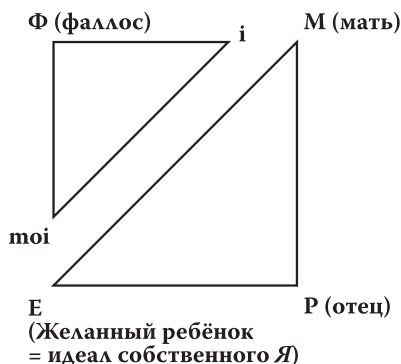
Рис. 2. Треугольник воображаемый и треугольник символический 29

Как же связана тема желания в психоанализе с темой опосредования? В работах Фрейда ключевой «треугольник» опосредования – это «ребёнок – мать – отец» и связанный с ним «комплекс Эдипа». На страницах семинара Образования бессознательного Ж. Лакана мы обнаруживаем этот же треугольник, но уже в визуальном воплощении и в несколько ином понимании, которое связано, прежде всего, с раздвоением фрейдовского треугольника на треугольник воображаемый (moi–Ф–i) и треугольник символический (E–M–P) (рис. 2).