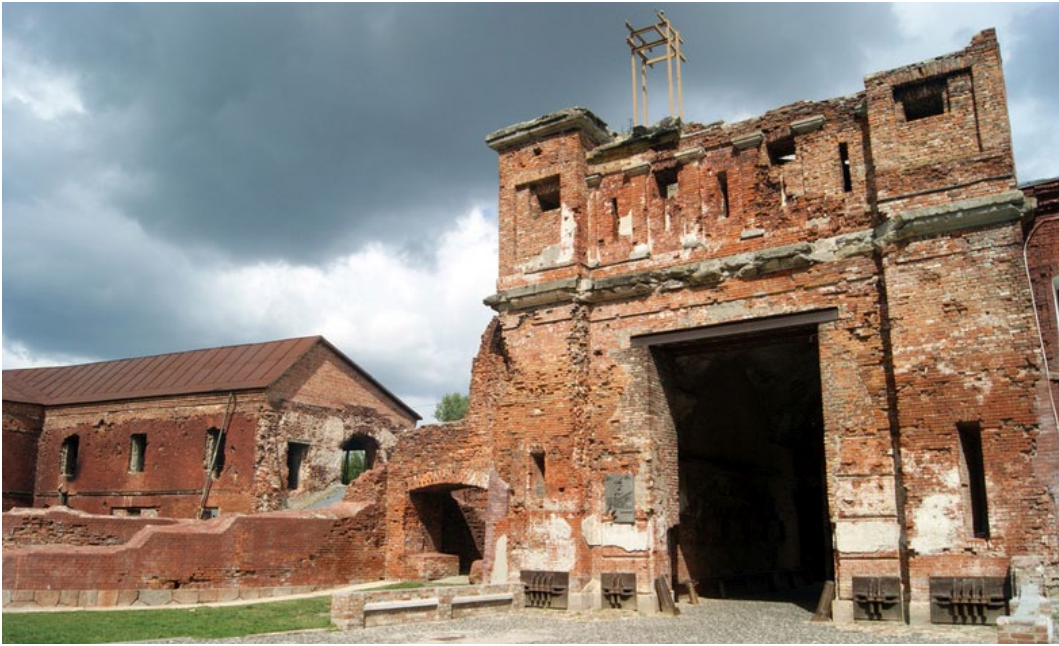
Цытадэль – абарончая казарма, руіны Белага палаца, Інжынернага ўпраўленьня, Арсеналу, казармы памежнікаў, падмурак сталовай каманднага складу