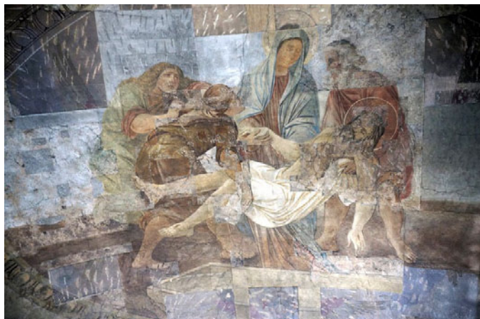
Адрэстаўраваны роспіс XVIII стагоддзя ў Саборы святых апосталаў Пятра і Паўла у Мінску. Творчая майстэрня «Басталія»