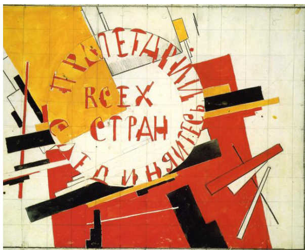
Люстрацыя 3. Казімір Малевіч. «Пролетарыі всех стран...». 1918; папера, гуаш, аловак; 27×37 см. Прыватны збор

Неапрымітывізм, футурызм, кубізм... Малевіч – класік у кожнай з мастацкіх плыняў. З 1911 г. ён пачынае працаваць і як графік, і як мастацкі рэдактар розных брашураў і кніг. Свой новы стыль мастак назваў супрэматызмам. У снежні 1915 г. адбылася «апошняя футурыстычная выстава» пад назвай «0,10» і выйшла брашура «Ад кубізму да супрэматызму. Новы жывапісны рэалізм». Ён быў адным з лідараў рэвалюцыі ў мастацтве, да таго як яна адбылася ў краіне. Малевіч шукаў еднасці першатворнай, дзе вера, мастацтва і філасофія суіснавалі ў адным. Таму і рэвалюцыю 1917 г. прыняў з захапленнем. Напярэдадні, у 1916 г., мастака прызвалі ў царскую армію, дзе ён служыў да канца 1917 г. Пасля Кастрычніцкай рэвалюцыі Малевіч разгарнуў шырокую грамадскую дзейнасць, займаў шэраг важных пасадаў у органах Наркамата асветы. Малевіч, роўна ж як і Шагал, найперш выступае як «мастак-камісар», актыўна ўдзельнічае ў рэвалюцыйных пераўтварэннях, у тым ліку і ў манументальнай агітацыі. Услаўляе «новую планету» мастацтва авангарду ў артыкулах газеты «Анархія».