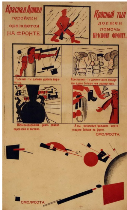
Ілюстрацыя 2. Страмінскі У. «Красная Армия героически сражается на фронте. Красный тыл должен помочь красному фронту». 1920. Хромалітаграфія; 73×44,5

Вайна вымушае Марка Шагала паступіць на цывільную працу ў ваенным ведамстве ў Петраградзе, каб не патрапіць на фронт. Ва ўспамінах пра Петраград прасочваецца пэўная разгубленасць: тут яшчэ больш моцна адчуваецца вайна, тут ён зрабіўся сведкам габрэўскіх паграмаў, тут было няўтульна, шэра... Таму з любой магчымасці Марк Шагал імкнецца вярнуцца зноў у Віцебск.