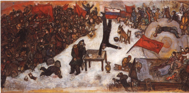
Ілюстрацыя 4. Марк Шагал. «Рэвалюцыя». 1937; палатно, алей; 100×50 см. Прыватны збор Крыніца: https://www.wikiart.org/ru/mark-shagal/revolyutsiya-1937

Знаходзім у «Дзённіку» Фердынанда Рушчыца, які да рэвалюцыі быў цалкам лаяльным грамадзянінам імперыі, запіс, зроблены пахмурным лістападаўскім днём 1917 г. у Багданаве: «Бедная Расея! Усе выракаюцца яе з-за бальшавікоў!...» 13 .