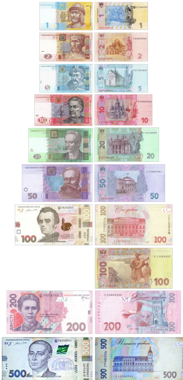
Иллюстрация 3. Украинские гривны