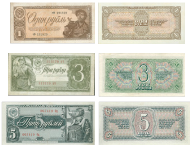
Иллюстрация 1. Советские рубли с народными героями