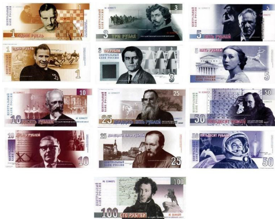
Иллюстрация 6. «Новые деньги» Источник: «Новые деньги» (2017)