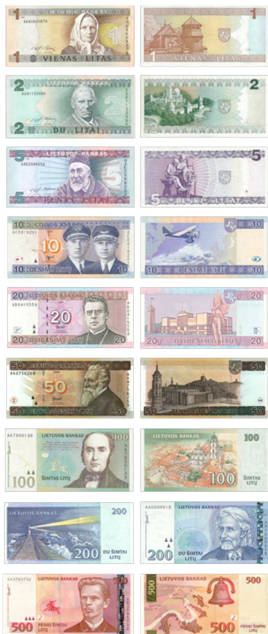
Иллюстрация 4. Литовские литы