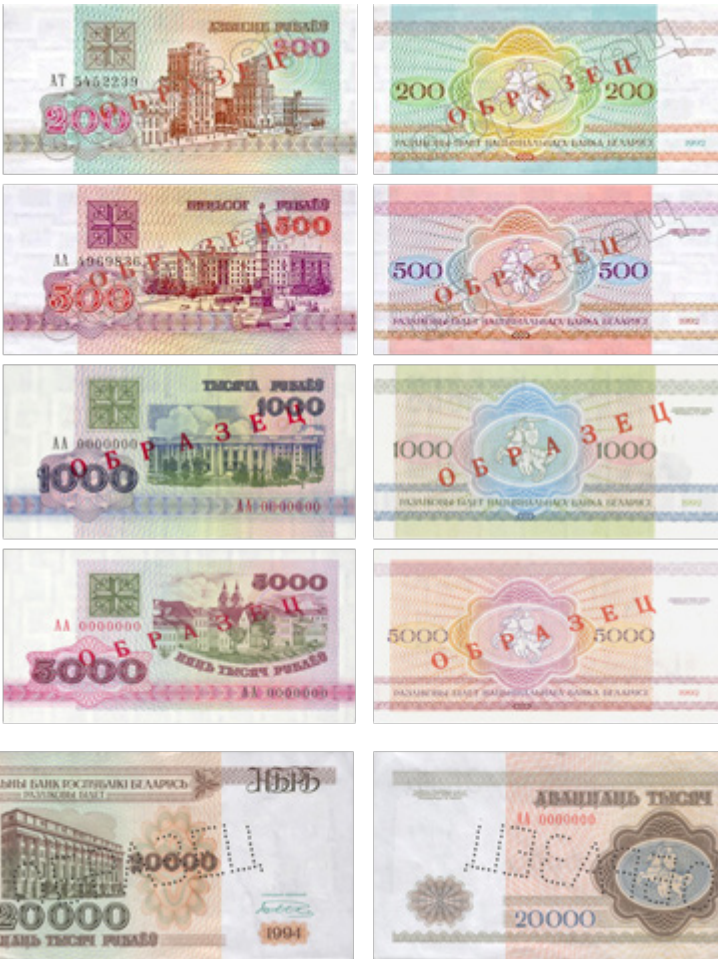
Иллюстрация 9. Городская серия с видами Минска (1992–1994 гг.)