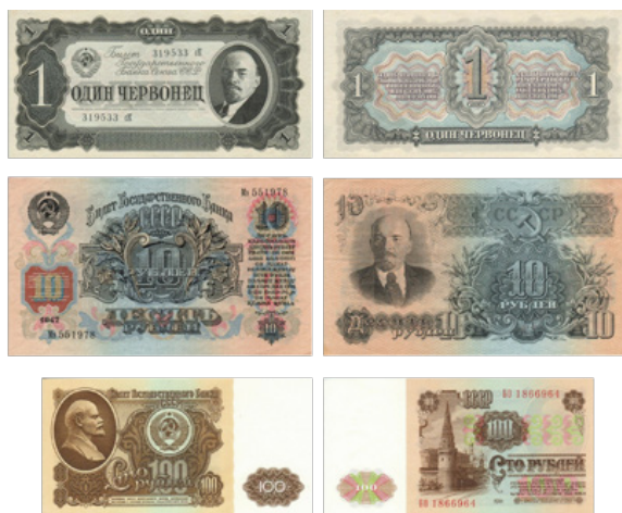
Иллюстрация 2. Советские деньги с портретами Ленина