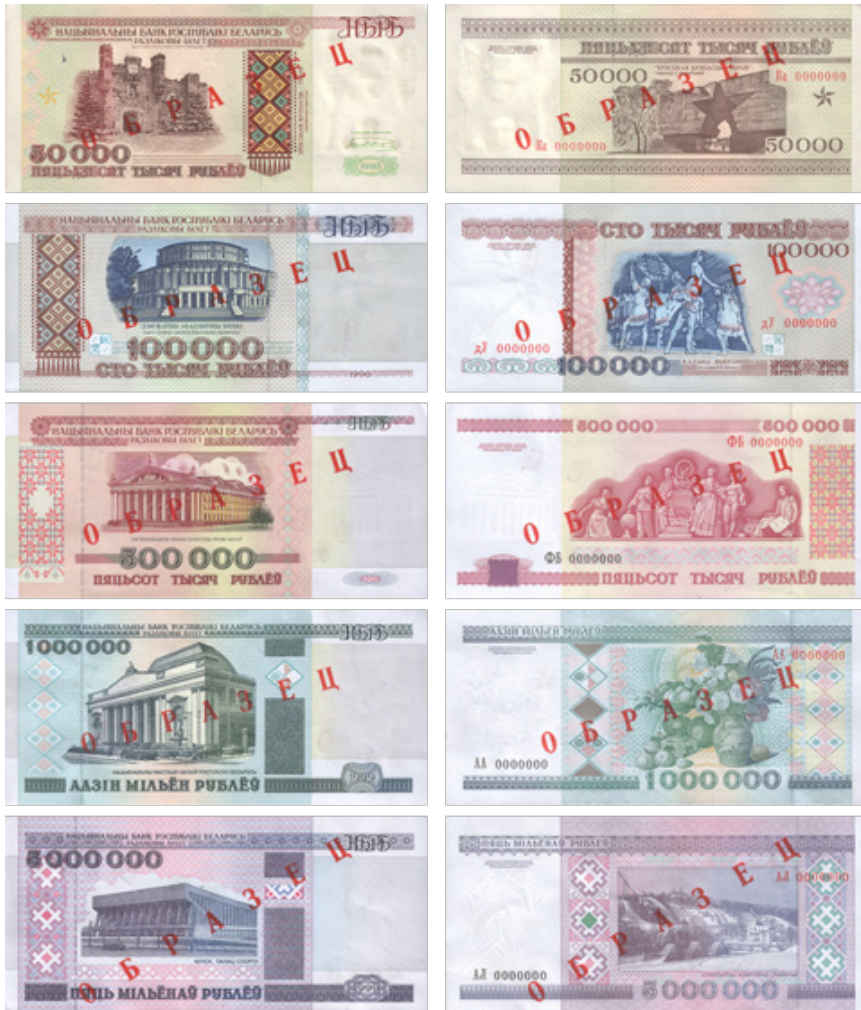
Иллюстрация 11. Городская серия с видами Минска (1994–1999 гг.)