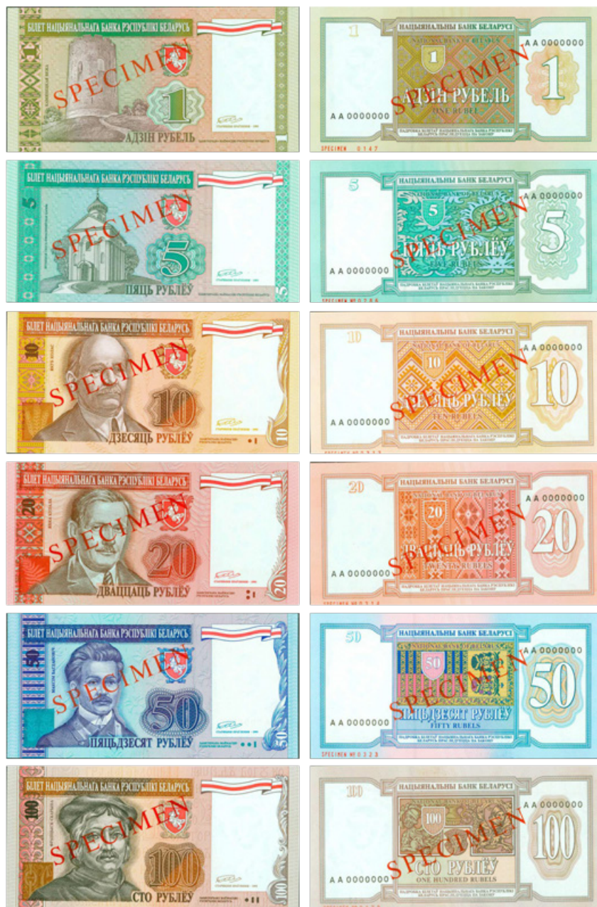
Иллюстрация 13. Альтернативный проект белорусских рублей с портретами (1994 г.)