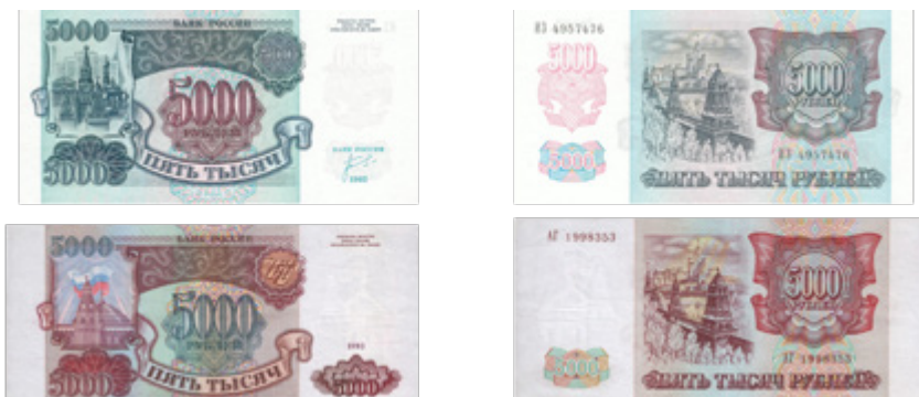
Иллюстрация 5. Первые российские рубли