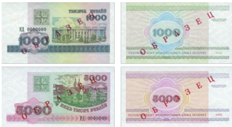
Иллюстрация 10. Банкноты с заменой «Погони» на изображение номинала (1998 г.)