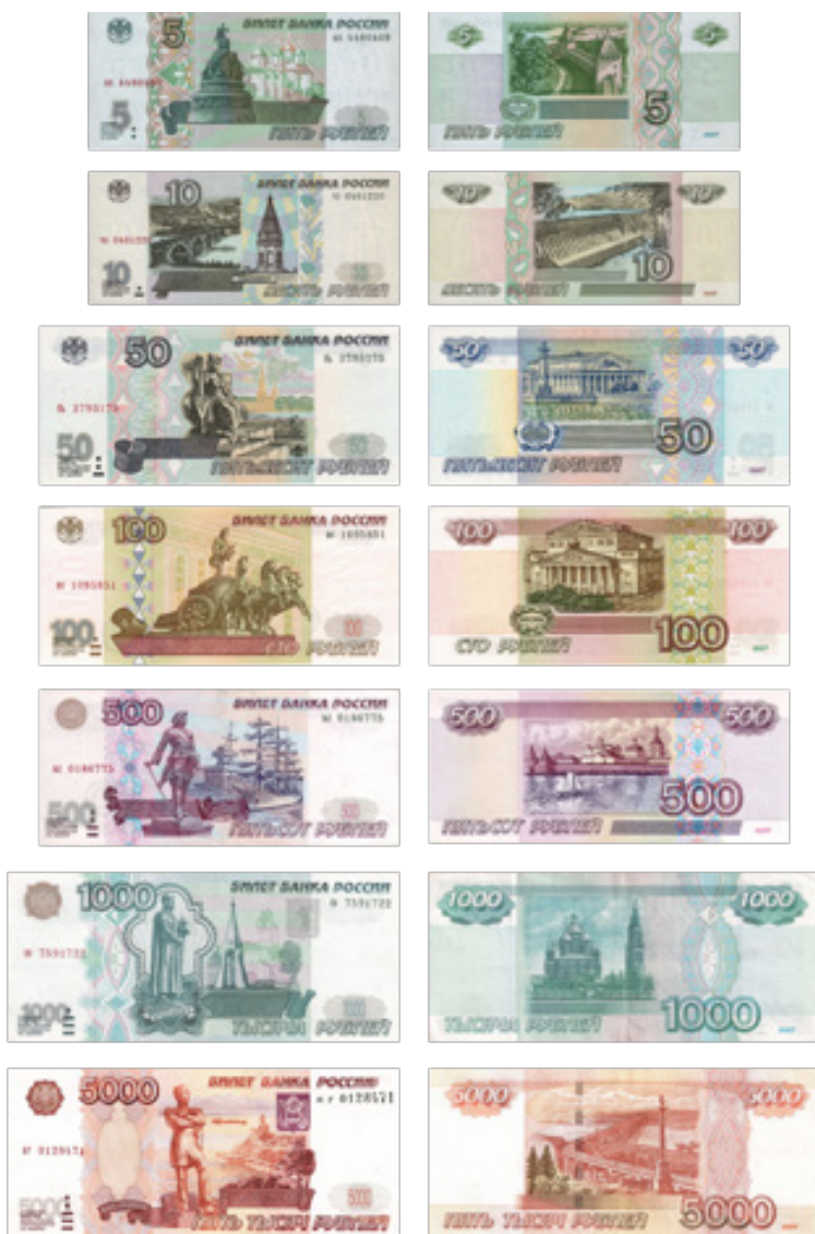
Иллюстрация 7. Современные российские рубли