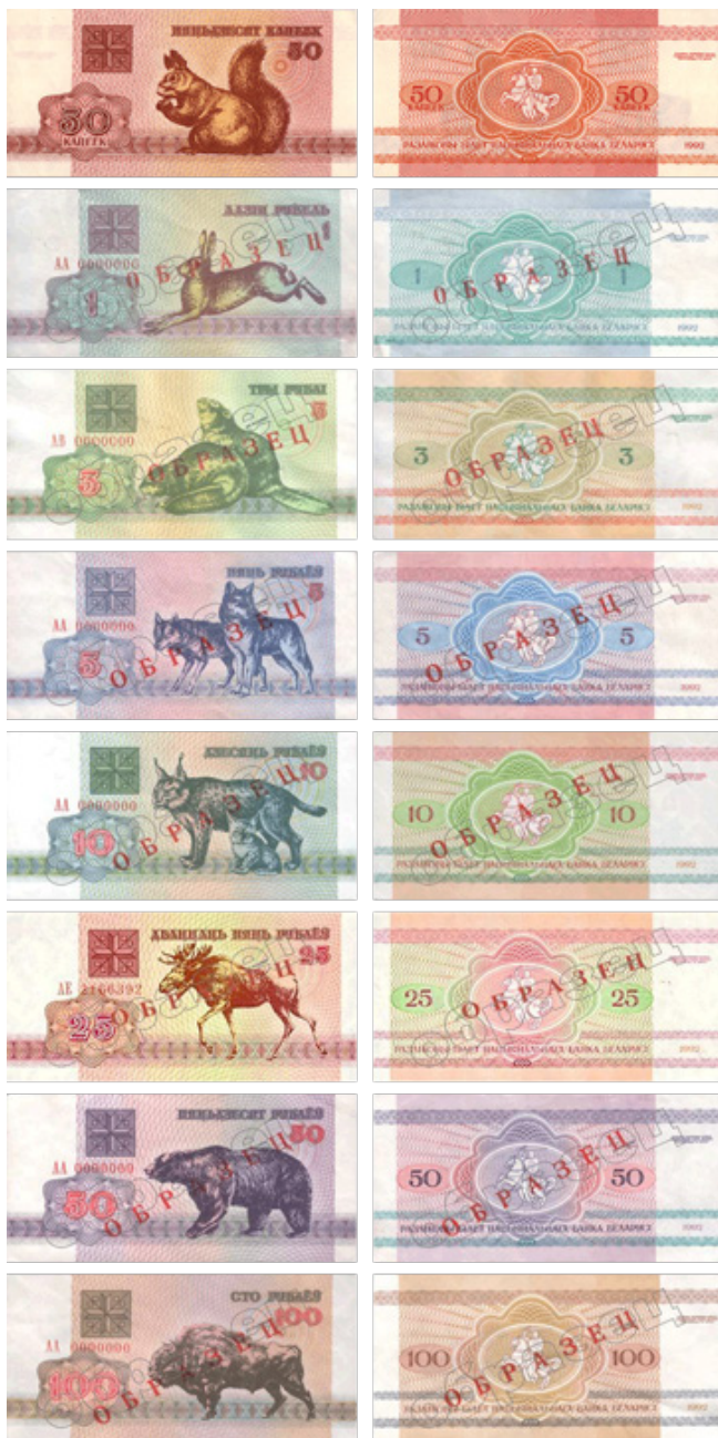
Иллюстрация 8. Белорусские «зайчики» (1992 г.)