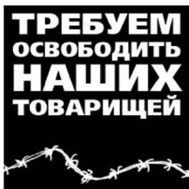
Мал. 5. «Патрабуем вызваліць нашых таварышаў»