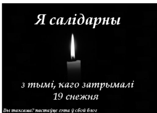
Мал. 3. Аватар ініцыятывы змены профільнай выявы ў блогавай сістэме livejournal.com