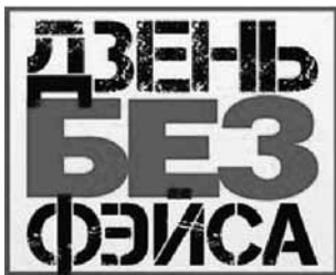
Мал. 2. Аватар ініцыятывы Дзень без фэйса

Дата 19 снежня была яшчэ адзначана ініцыятывай, ідэя якой была агучана загадзя – т. зв. акцыя Дзень без фэйса . Карыстальнікам сацыяльнай сеткі facebook прапаноўвалася замяніць свае профільныя выявы («аватары», «юзэрпікі») на малюнак (мал. 2).