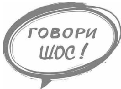
Мал. 7. Рэстайлінг лагатыпу адной з грамадскіх кампаніяў пад ШОС

Нягледзячы на трагічнасць падзей, некаторыя карыстальнікі ўсё ж не гублялі пачуцця гумару і прыдумвалі забаўляльныя акцыі, такія як кампанія ШОС 55 ці флэш-моб з рондалямі 56 . Фантазія народных гумарыстаў наконт ідэі ШОС была развіта далей, пра што сведчыць альбом калажаў у суполцы на рэсурсе vkontakte.ru 57 .