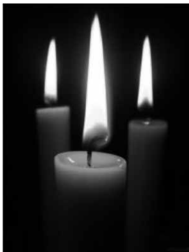
Мал. 6. Свечкі як сімвал салідарнасці з пацярпелымі

З пачаткам акцыі пратэсту – Плошча-2010 – у сацыяльных сетках і блогу livejournal 24 пачалася анлайнавая трансляцыя з месца асноўных падзей. Акрамя тэкставай быў вялікі аб’ём і мультымедыйнай інфармацыі: фотаздымкі і відэазапісы (журналісцкія і аматарскія). 25 Прамую трансляцыю з акцыі вёў інфармацыйны партал tut.by .