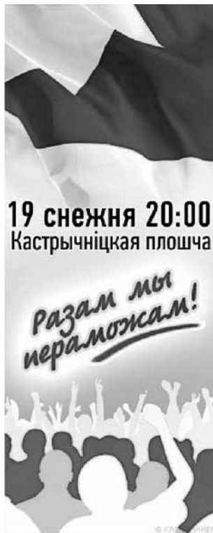
Мал. 1. Аватар з заклікам выйсці на Плошчу 19 снежня. Актыўна распаўсюджваўся ў сацыяльнай сетцы vkontakte.ru

Не засталася па-за ўвагай прэзідэнцкая кампанія і ў сацыяльных сетках. Так, на рэсурсе vkontakte.ru можна вылучыць тры асноўныя інфармацыйныя суполкі выбарчай тэматыкі: «Выбары 2010. Беларусь» 8 ; «Выборы 2010: in-by.net (приложение, биографии, программы и пр.)» 9 і «Президентские выборы 2010 (Беларусь). Экзит-пул. ЗА КОГО ГОЛОСОВАЛИ ВЫ?» 10 . Акрамя таго, на гэтым жа рэсурсе была створана суполка 11 з заклікам сабрацца на Кастрычніцкай плошчы ўвечары 19 снежня (мал. 1).